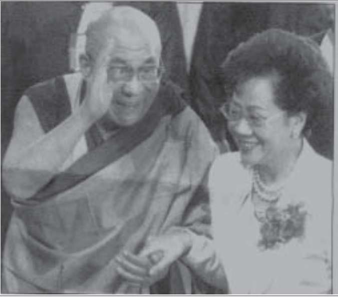
སྲིད་འཛིན་སྐྱེ་གཞིན་ནས་ལགོང་ས་མཚོན་སྟོན་ལམ་ཆོགས་མགོན་དུ་གདན་འདྲན་ཞུ་བཞིན་པ། ཚུ་ཚོད་ ༤ པའི་ཐོག་ཐོ་ཕྱན་གྱི་སྲིད་འཛིན་གཞིན་པ་ལྷུ་སྐྱེ་ལོས་འདུ་ལན་མཚོན་དང་། རང་པ་དང་། ཏའེ་ཅའོ། ཡེ་གུ། ཨི་སི་ལམ་སོགས་ཆོས་ལུགས་ཁག་བརྒྱ་བཏོག་གི་དབུ་འཛིན་རྒྱ་མ་བརྒྱུ་བཞུགས་པ་དང་། དེ་དག་གི་རྗེས་འཛུགས་པ་སོགས་མང་ཆོགས་ཉིས་ཁྲི་ཇ་སྟོང་བཞུགས་པའི་འཛུལ་སྐྱེང་ཞི་བདེའི་སྐྱོན་ལམ་གྱི་ཆོགས་མགོན་དུ་ལགོང་ས་མཚོན་ཅིང་ཤིན་པའི་གནང་། སྲིད་འཛིན་སྐྱེ་གཞིན་ནས་གསུང་འདུད་ཀྱི་གསུང་བཤད་གནང་སྐབས། ལགོང་ས་ལ་སྐབས་མགོན་ཏུ་ལའི་ལྷ་མ་མཚོན་ཅིང་སངས་རྒྱལ་བཅོམ་ལྡན་འདས་དང་གཉིས་སུ་མེད་པའི་མཁུན་

ཕྱི་པའི་སྤྱི་གཞུགས་ལ་བརྩོ་བཀའ་རྒྱབ་སྐྱོར་དང་། དེ་བཞིན་སོ་སོའི་མི་རིགས་ཀྱི་ཆོས་དང་རིག་གཞུང་དང་། ཡ་རབས་བཟང་པོའི་གོམས་སྲོལ་རྣམས་མི་ཉམས་གཅེས་འཛིན་བྱེད་དགོས་པ། ལྷག་པར་རྒྱ་མ་དགེ་འདུན་རྣམས་ཀྱིས་སངས་རྒྱལ་གྱི་བརྟན་པ་སྐྱེ་དང་། རྒྱ་བྲག་རང་ཉིད་གནས་སའི་ས་གནས་ཀྱི་དང་ལྗན་མི་མང་རྣམས་ལ་ཆོས་དང་ཟང་ཟང་གི་ཕན་ཐོགས་ཁ་ཡོད་ལག་ཡོད་བྱས་ཏེ་བརྟན་པ་རྒྱལ་གྱི་འགོ་བ་བདེ་བ་ཡོང་ཐབས་བྱེད་དགོས་ཞེས་བཀའ་སྐྱོབ་སྐྱུལ། རྒྱུད་ཡོལ་ནང་ཆོས་དང་ཅན་དང་སྐྱོབ་གྲུའི་དགོས་པ། གཞན་ཡང་མི་མང་བཅས་མི་གུངས་སུ་མ་ཁྲི་བཞུགས་པར་དུས་རབས་ཉེར་གཅིག་པའི་ནང་གི་རྒྱང་དོར་བྱེད་སྐྱོ་ཞེས་པའི་བརྗོད་གཞིའི་ཐོག་ནས་བཀའ་སྐྱོབ་ཚུ་ཚོད་ལྟར་གཉིས་རེར་སྐྱུལ་བར་མང་ཆོགས་ནས་དགའ་བསུའི་ཐལ་མོ་ཡང་ཡང་བཟང་པོ་པ་དང་། བཀའ་སྐྱོབ་སེམས་ལ་ཏ་ཅང་ལུག་པོ་བྱུང་བར་བརྟན་མང་པོ་ཞིག་རང་དབང་མེད་པར་དད་པའི་སྐྱོ་ཡོང་གཡོས་ཏེ་མིག་ཚུ་དབང་མེད་དུ་གྱོར་བ་དང་། ཏུ་ལའི་ལྷ་མ་སངས་རྒྱལ་སྐྱེ་དངོས་རེད་ཅེས་ཕན་ཚུན་དོ་མཚན་གྱི་སྐྱེང་མོལ་བྱེད་པ་དང་། འདོད་གསོལ་སྐྱོན་ལམ་འདེབས་པ་སོགས་མི་སེམས་འགྲུལ་བའི་སྣང་ཚུལ་གང་སར་ཁུར་ཡོད་པ་རེད། ཕྱི་དྲིའི་