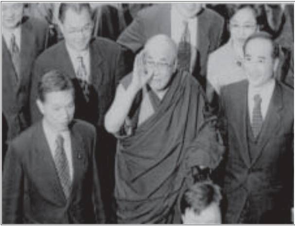
གོ་སྐོར་ཚོགས་གཙོ་ཕྱི་མང་ལྷན་ཚོགས་མཆོག་གིས་ཚོགས་སུ་གདན་འདྲན་ཞུ་བཞིན་པ།

བ་བཅས་གོང་འཕེལ་གཏོང་ཐབས་དང་། བོད་རྒྱལ་འབྲེལ་བ་དང་། བོད་ནང་གི་གནས་སྟངས། ཐོ་བོད་གཉིས་ཀྱི་མང་གཙོའི་འཕེལ་རིམ་སོགས་སྐོར་དགོངས་ཚུལ་བཟུང་ལེན་སོགས་གསུང་མོལ་ནང་གཤམ་དུ་གནང་། དབུ་བྲིད་རྣམས་ནས་ཡགོང་ས་མཆོག་གི་དགོངས་པ་ནི་སྤྱི་སྤོམས་ཉེ་མ་ལྟ་བུ་རེད་ཅེས་གསུངས་པ་དུས་བཟུངས་